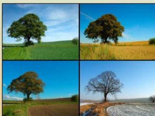
Les Quatre Estacions

Draps és un espectacle on la natura hi té molta importància. Al llarg del seu viatge en Draps té relació amb molts personatges: la lluna, el vent, el riu. Passa pel bosc i puja la muntanya. Les estacions de l'any hi són molt presents. Us proposem un estudi sobre les fases, les estacions i els cicles de tots aquests elements de la natura: