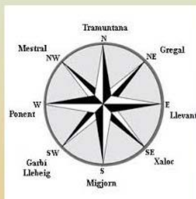
La Rosa dels Vents